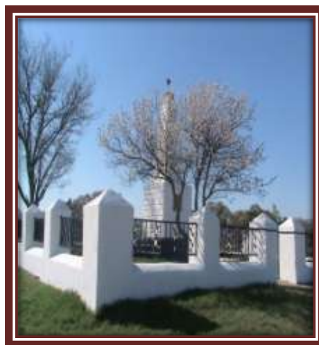
Обелиск на могиле.