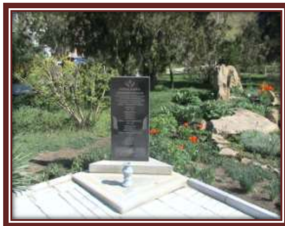
Памятник Воинам – интернационалистам.