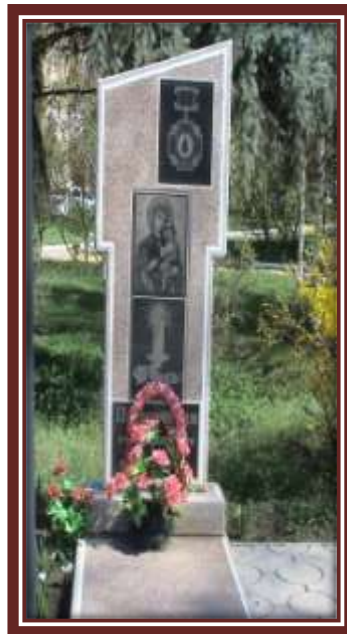
Памятный камень. Памятник ликвидаторам Чернобыльской катастрофы.