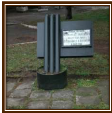
Памятник 133 минометного полка.