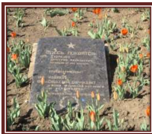
Фото 28. Памятная плита.