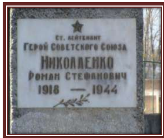
Памятник Николаенко Р.С.