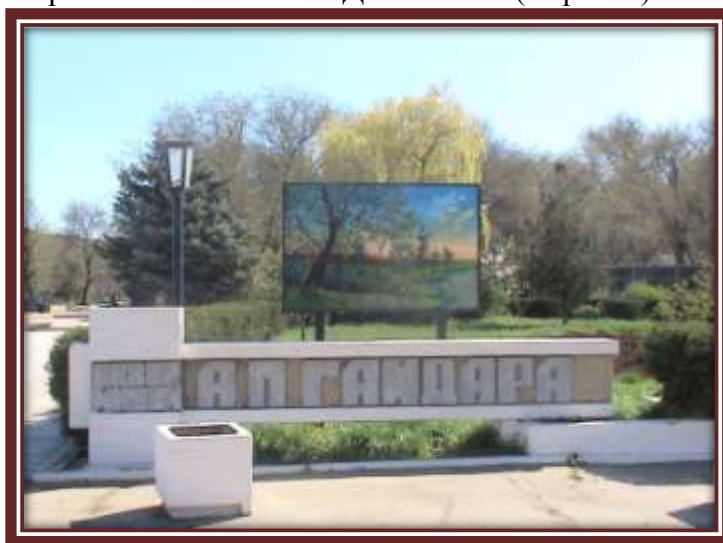
Парк имени А.П. Гайдара