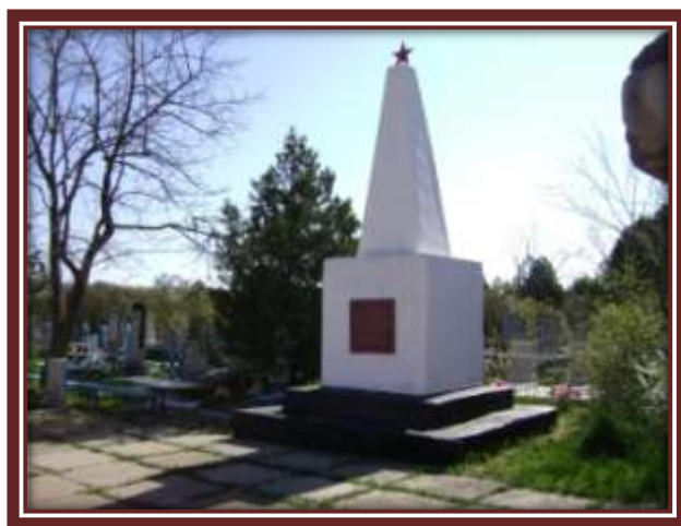
Памятник на старом гражданском кладбище.

На старом гражданском кладбище находится братская могила разведчиков красной армии, погибших от рук полицаяв в день наступления на Петровское и освобождения его от захватчиков 19 января 1943 года (так написано на мемориальной доске, установленной на обелиске). На могиле в 1958 году воздвигнут каменный обелиск ступенчатой формы. Он сооружен из бутового камня, наружный слой оштукатурен и покрашен известью. Высота его 5 метров. На верху установлена пятикопеечная звезда.