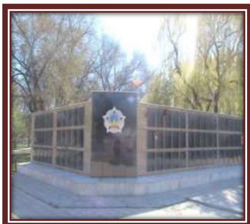
Фото 27. Стена памяти.