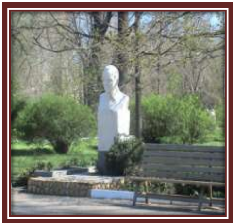
Памятник А.П. Гайдару